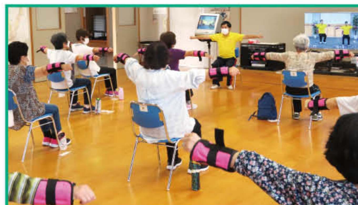
▲戸奈良はつらつ体操会