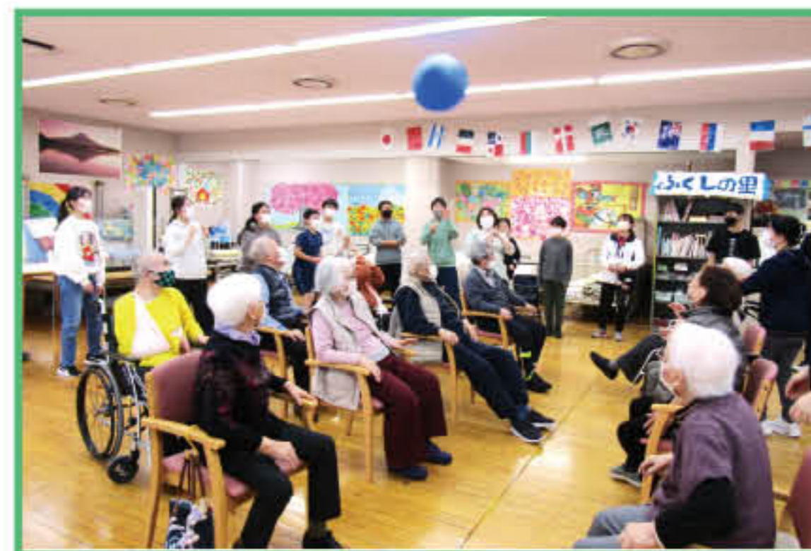
▲ふくしの里 (天明小学校との交流)