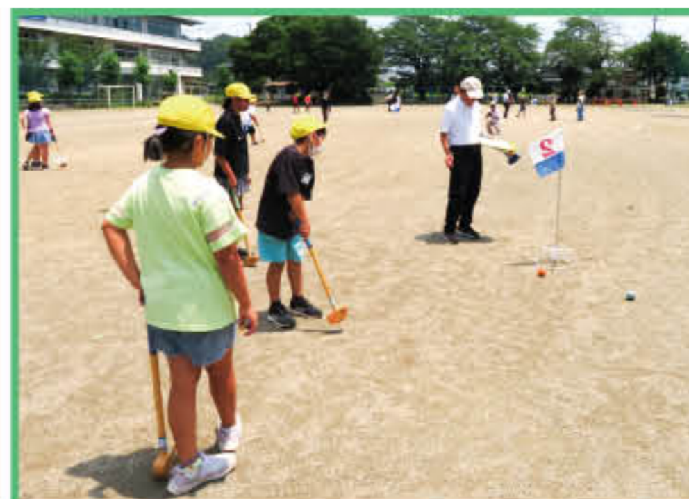
赤見小学校 グラウンドゴルフ 体験