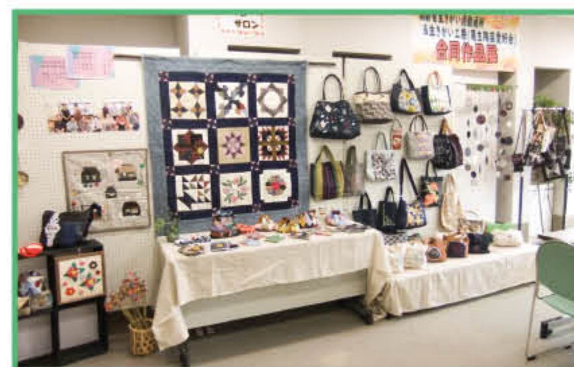
あくとしきがい サロン作品展