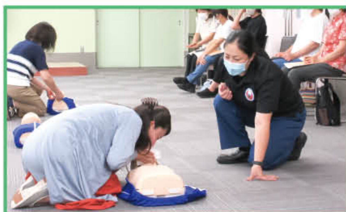
▲ファミリー・サポート・センターさの 講習会 普通救命講習Ⅲ (小児・乳児に対する応急手当)