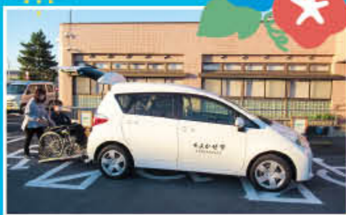
▲ラクティス1300cc (佐野本所、田沼支所)