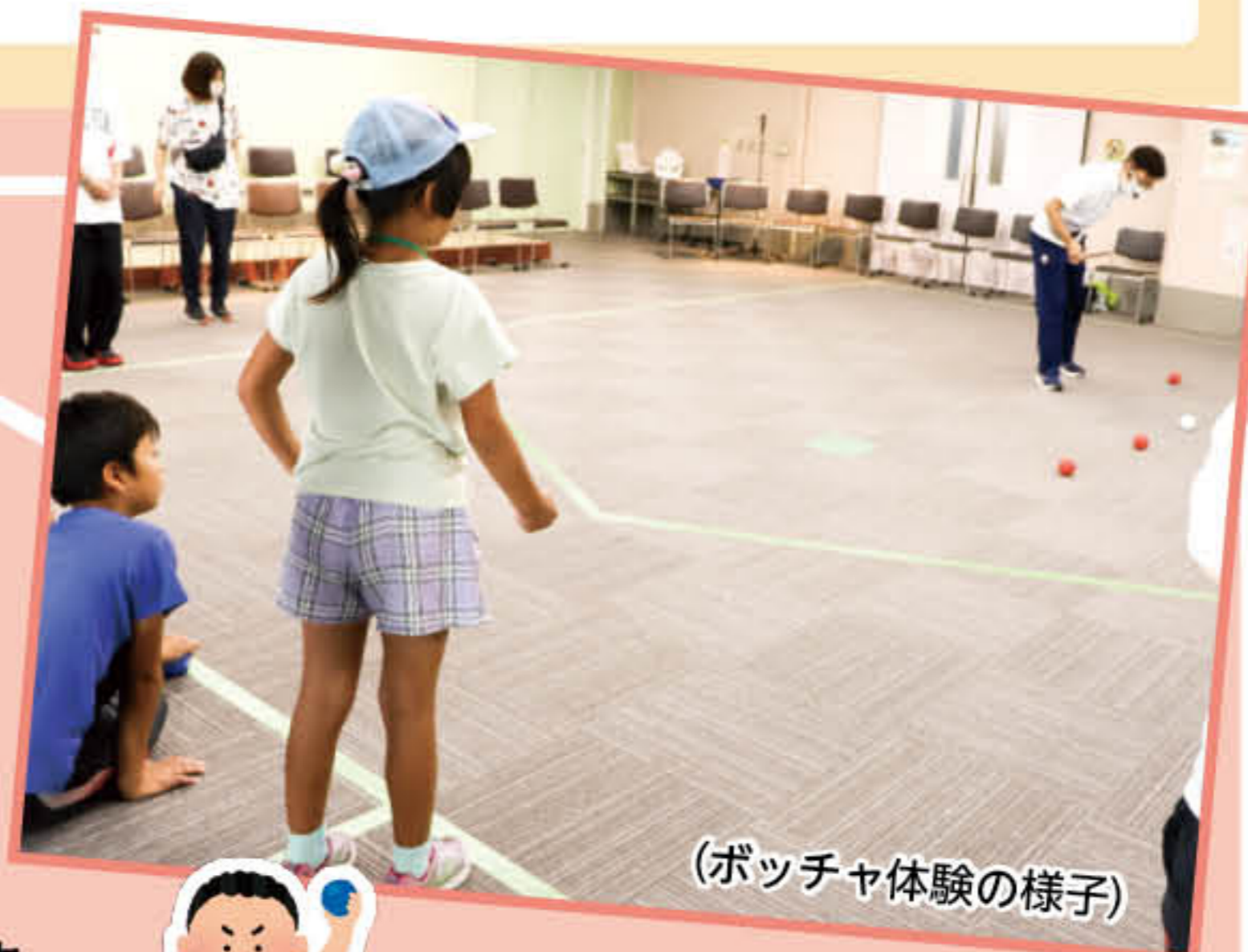
(ボッチャ体験の様子)