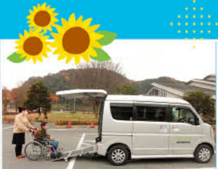
▲エプリイワゴン660cc (葛生支所)