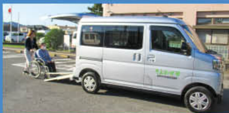
〈佐野本所〉 アトレー660cc