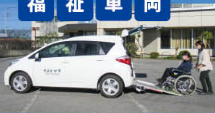
〈田沼支所〉 ラクティス1300cc