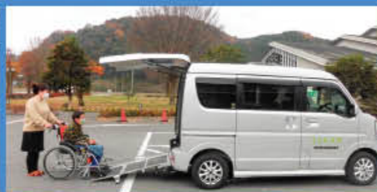
〈葛生支所〉 エプリィワゴン660cc