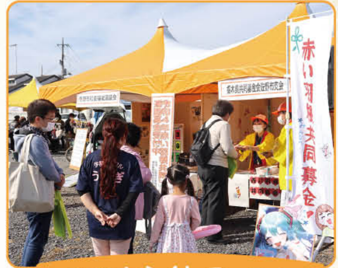
佐野市ふくしフェスタ 2022開催の様子