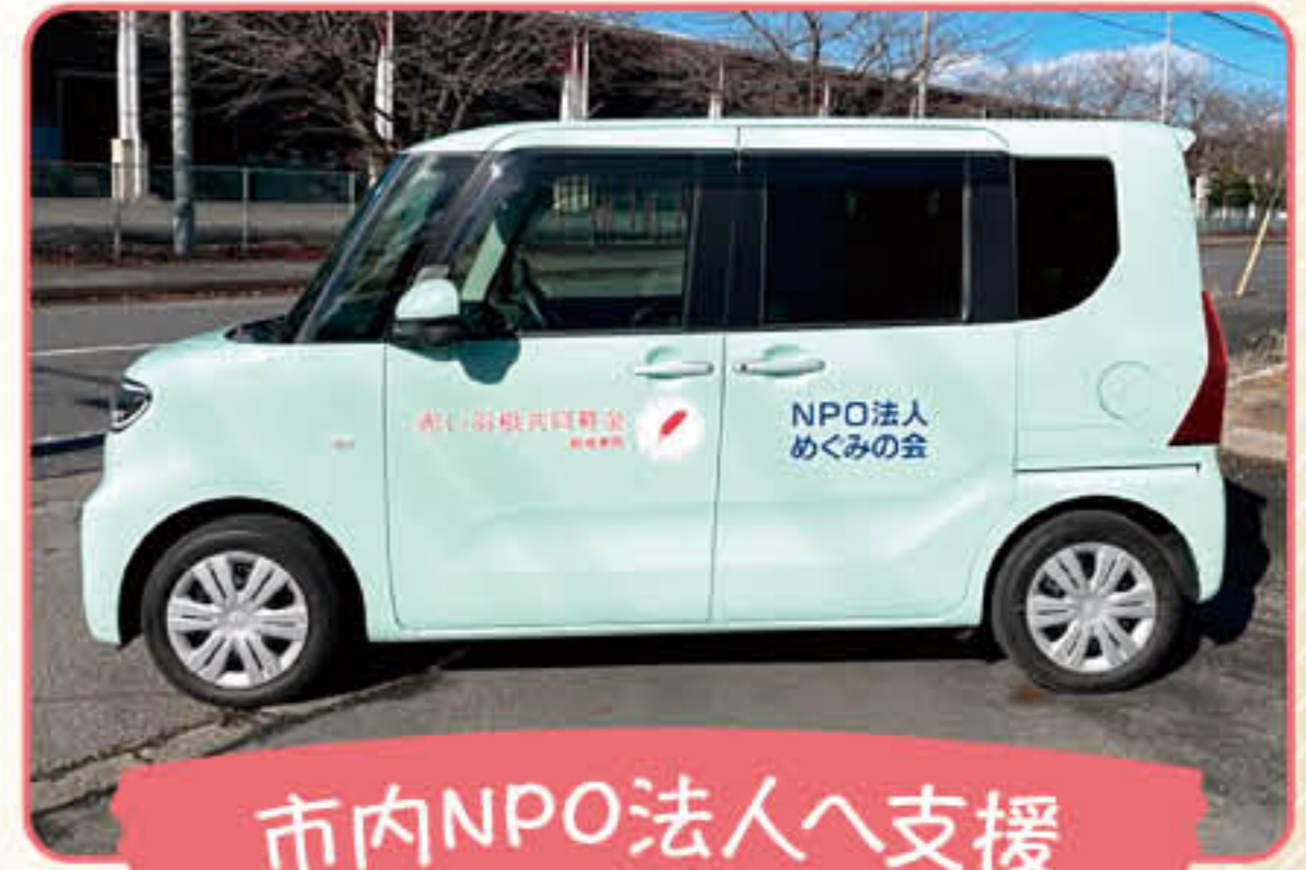
市内NPO法人へ支援 車両の助成