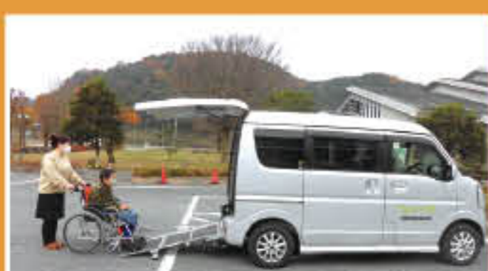
▲エブリイワゴン660cc (葛生支所)