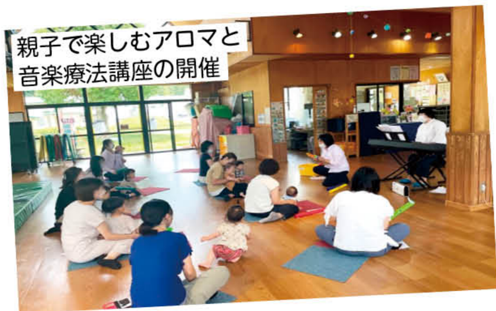
親子で楽しむアロマと音楽療法講座の開催

皆様から寄せられた募金は、地域のみなさんが自主的に取り組む活動や災害支援に活用されています。