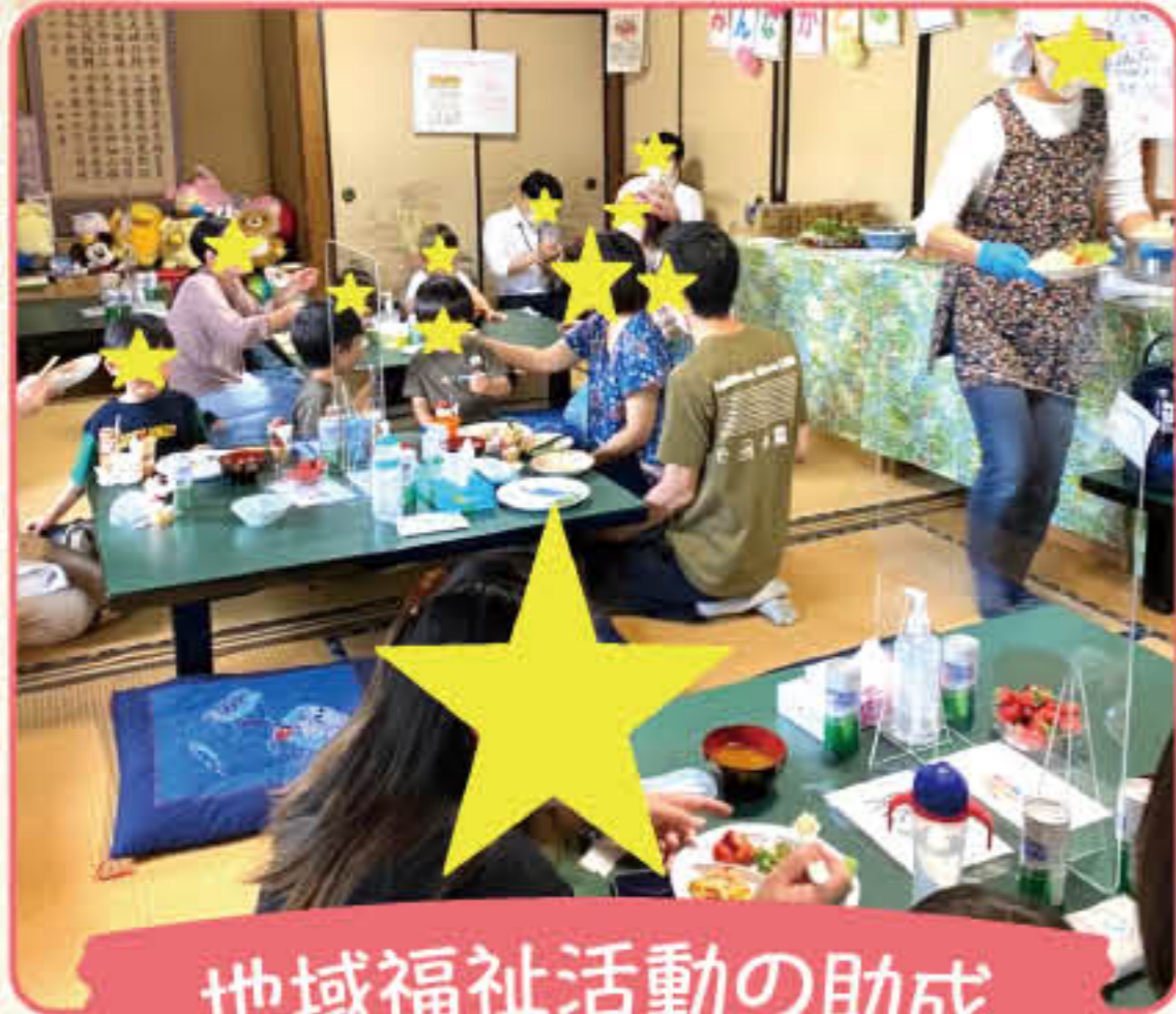
地域福祉活動の助成 こども食堂の様子