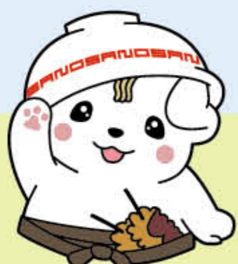
佐野ブランドキャラクター さのまる ©佐野市