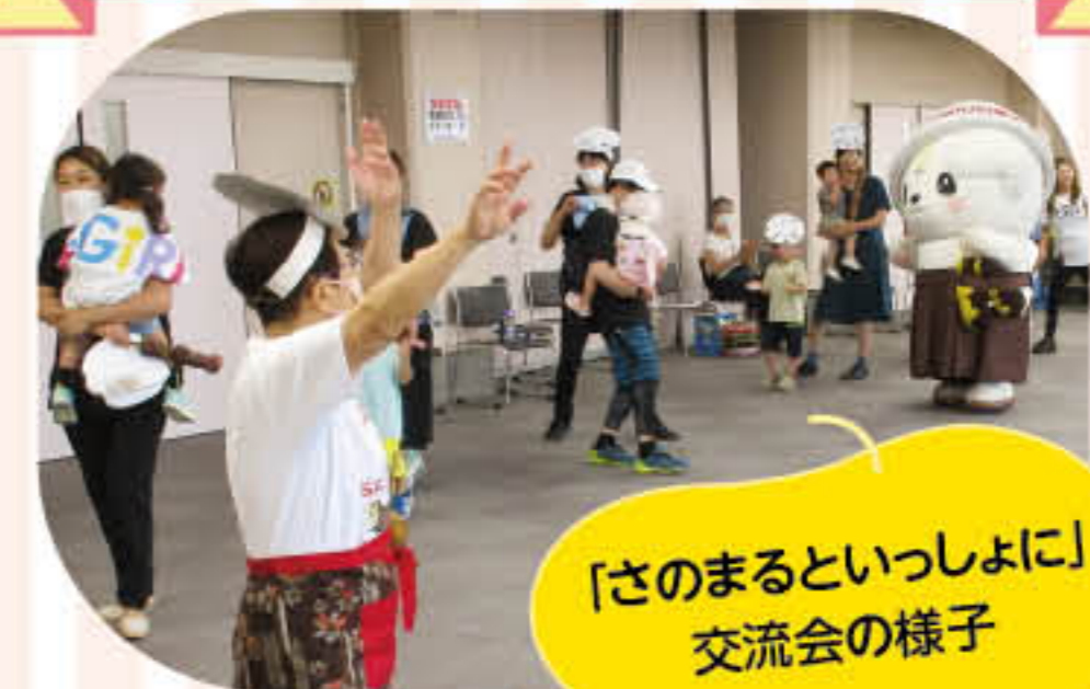
「さのまるといっしょに」交流会の様子

お気軽にファミサポまでご連絡下さい。 申込・問合せ ファミリー・サポート・センターさの ☎(22)0115