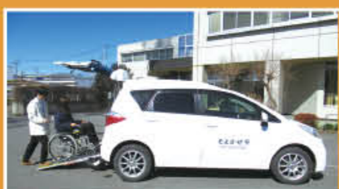
▲ラクティス1300cc (佐野本所、田沼支所)