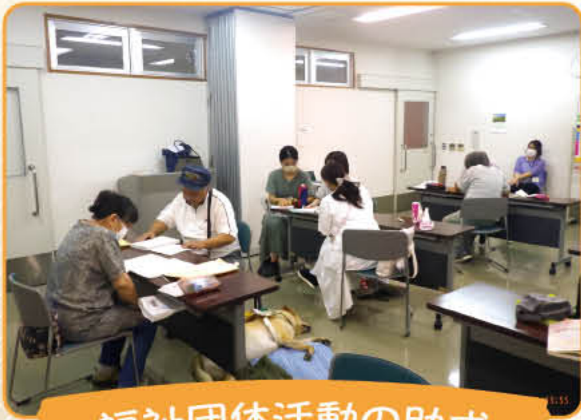
福祉団体活動の助成 佐野点訳サークルこぼと会 活動の様子