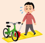
警告ブロック 誘導ブロック